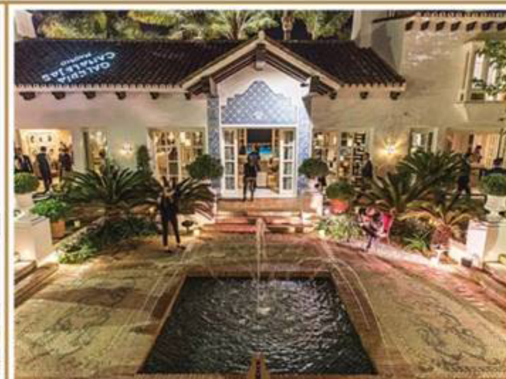
A festa oferecida pela Galeria Canalejas rolou na Vila mais cara da Europa ocidental no Marbella Club Hotel