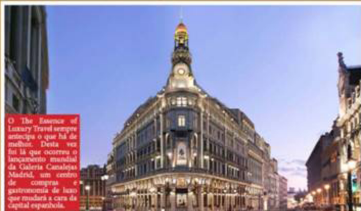
O The Essence of Luxury Travel sempre antecipa o que há de melhor. Desta vez foi lá que ocorreu o lançamento mundial da Galeria Canalejas Madrid, um centro de compras e gastronomia de luxo que mudará a cara da capital espanhola.

Para sua 5ª edição, o The Essence of Luxury Travel escolheu a cidade espanhola de Marbella, no sul da Espanha - um centro de férias conhecido por sua mistura eclética de jet-setters, boêmios e classe criativa - como pano de fundo para quatro dias de conferências, reuniões, jantares de gala e festas.