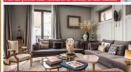
A recém inaugurada Maison Montepari em Paris é o super sumo do luxo no quinqüto hospedagem na Cidade Luz