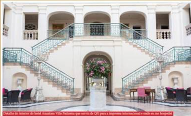
Detalhe do interior do hotel Anantara Villa Padierna que serviu de HQ para a imprensa internacional e onde se hospedou

Para esta edição eu escrevi uma coluna dedicada inteiramente ao principal encontro de turismo de luxo para ultra-ricos, ou UHNW (Ultra High Net Worth) como também são conhecidos. Tratam-se de famílias e pessoas que possuem patrimônio líquido disponível acima de US$ 30 milhões. Esta é a terceira vez que eu sou convidado para cobrir a cena, sendo assim me animei para contar aos meus preciosos leitores em Dife Brasil um pouco do que ocorreu naquele encontro pra lá de exclusivo. O programa The Essence of Luxury Travel é um encontro anual criado pelo Traveller Made, uma rede global de 390 designers de viagens de luxo. Trata-se da oportunidade perfeita para especialistas da indústria e imprensa encontrarem alguns dos 900 hotéis e fornecedores de viagens, especialistas e pioneiros da comunidade Traveller Made.