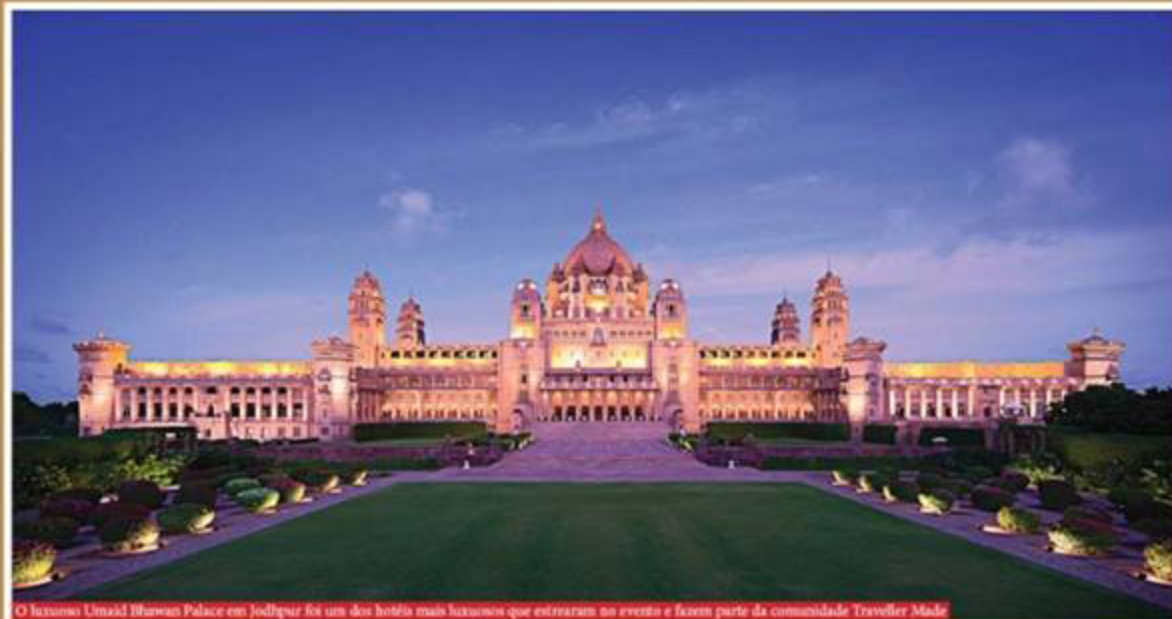
O luxuoso Umak Bhawan Palace em Jodhpur foi um dos hotéis mais luxuosos que estrearam no evento e fazem parte da comunidade Traveller Made

Com o objetivo de definir um novo tipo de viagem de luxo - a Haute Villégiature, que, assim como a Haute Couture e a Haute Cuisine, foca em criar experiências excepcionais sob medida para uma clientela exigente - o evento explora inspirações e conceitos que atualmente moldam o luxo da indústria em geral.